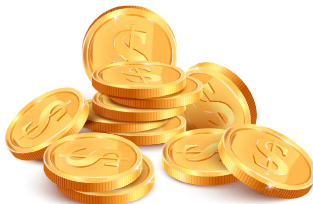
RIQUEZAS E OURO